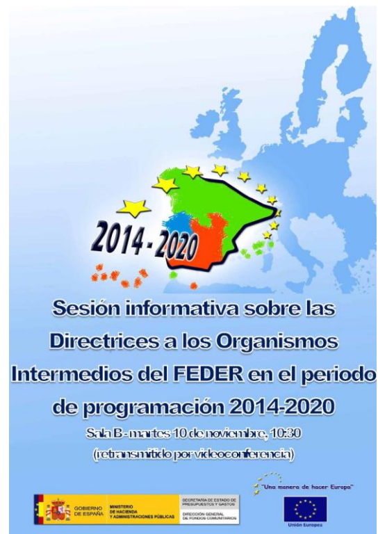
Cartel anunciador de la sesión