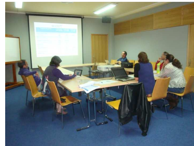
Reunión de trabajo en el marco de la acción 3.1, febrero 2011 : recursos marinos y ecoturismo