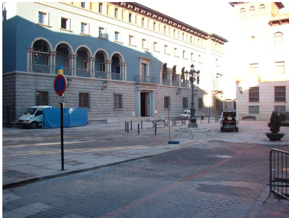
Pavimentación Centro Histórico