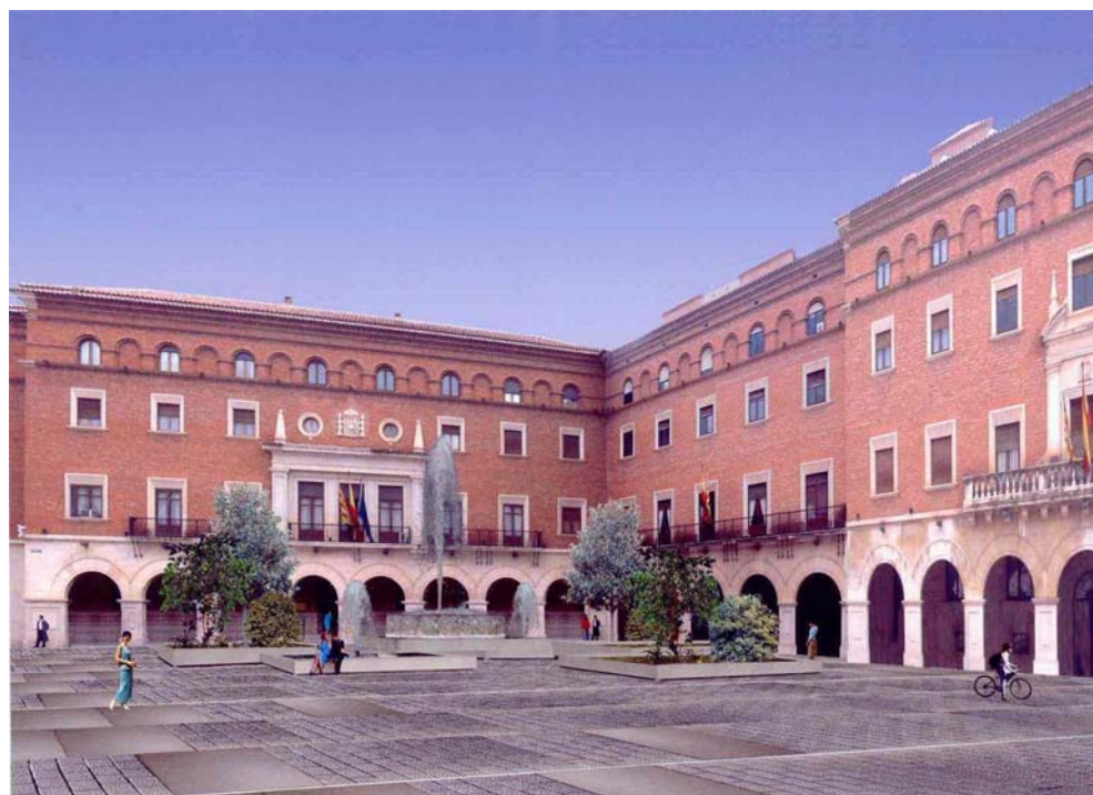
Plaza de San Juan