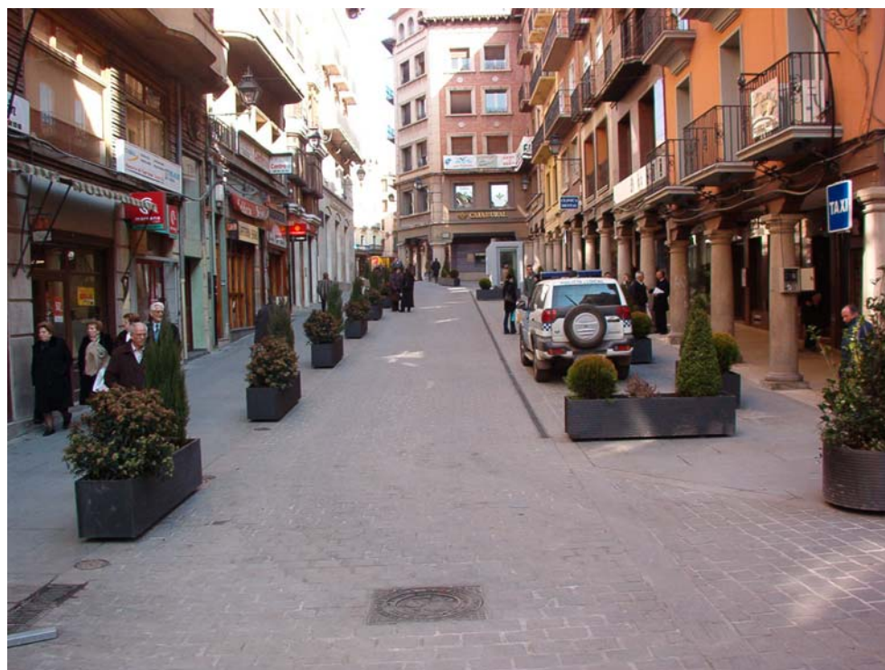
C/ San Juan