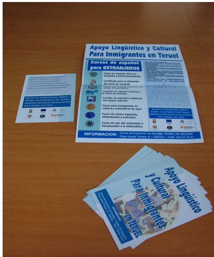
CCA y Cursos de inmigrantes