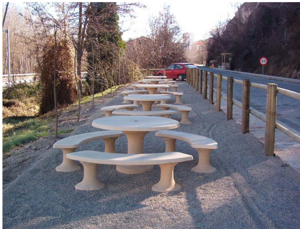
Recuperación zonas esparcimiento