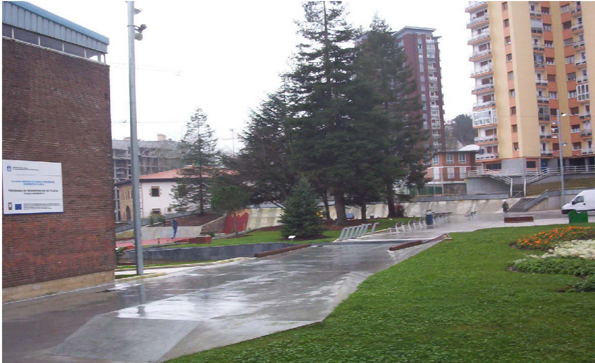
Figura 4- Visita de Paco Rabanne. Panorámica sobre el Área de Nueva Centralidad de La Herrera