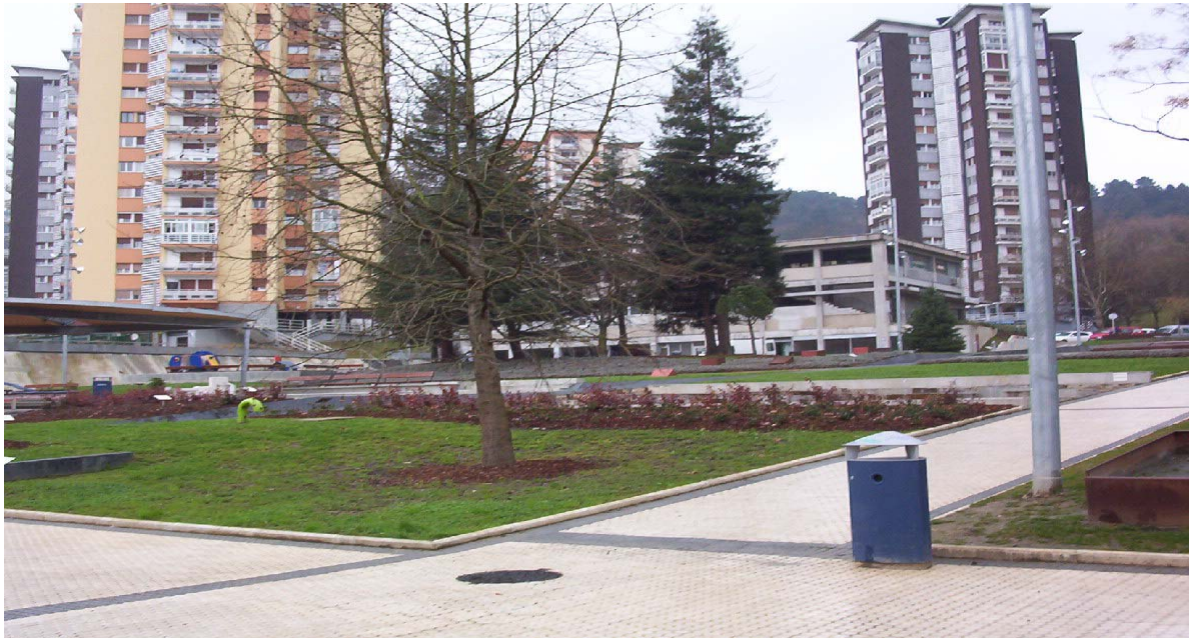
Figura 2- Programa de regeneración de plazas. La plaza de Bidebieta, ya casi finalizada. Vista desde el interior de la plaza.