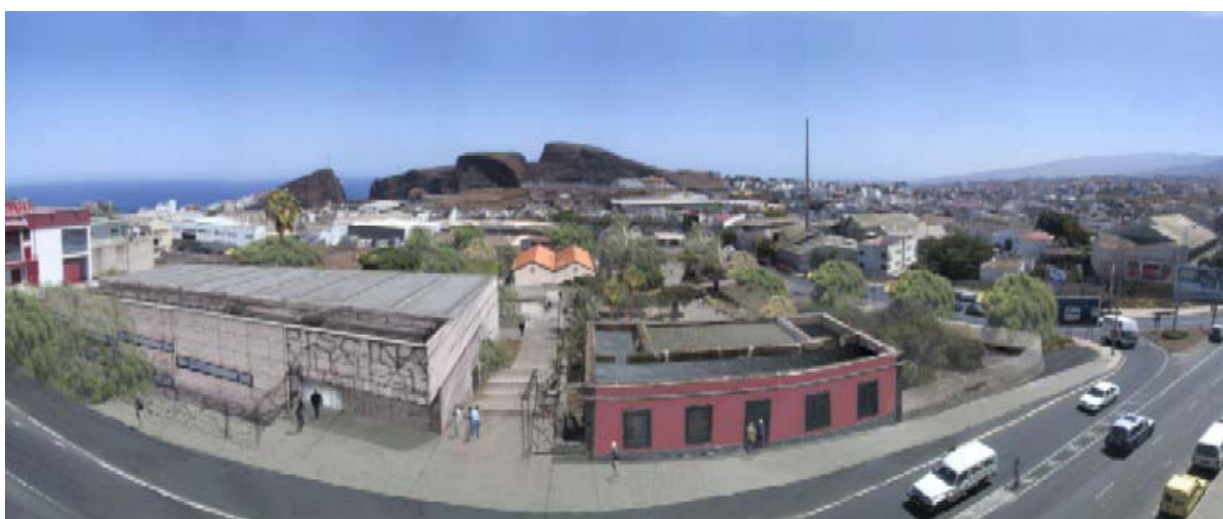
Montaje panorámico “Espacio Multifuncional El Polvorín”