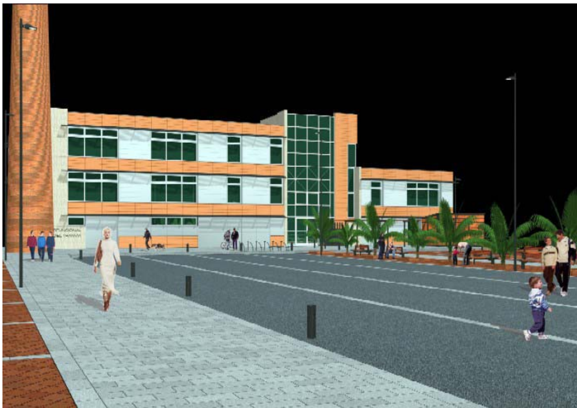
Montaje panorámico "Espacio Multifuncional El Tranvía"