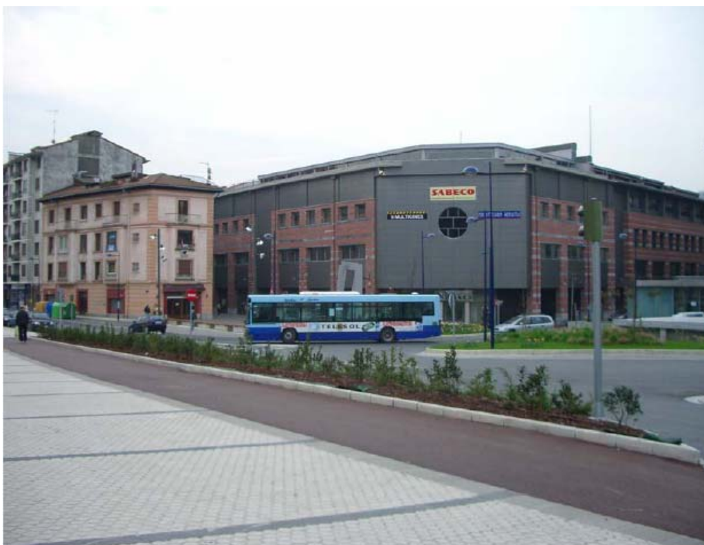
Figura 6 – Otro tramo de la transformación de la N-1 en Errenteria con la Plaza Fernández de Landa y el Soterramiento de Contenedores