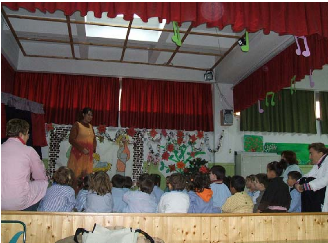
Centro de Educación Ambiental.