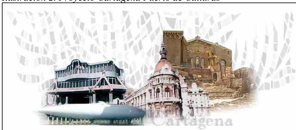
Ilustración 2. Proyecto Cartagena Puerto de Culturas

El objeto de este proyecto es crear un espacio temático, que a su vez abra un amplio abanico de posibilidades para dar a conocer la valiosa oferta cultural de la comarca. Asimismo, pretende situar a Cartagena como uno de los principales destinos turísticos aprovechando su amplia oferta cultural y patrimonial mostrando la historia y cultura de la ciudad, aprovechando el potencial histórico de Cartagena y su Puerto como recursos interpretativos. Además de mejorar la imagen turística de la ciudad, este proyecto reforzará la identidad de los cartageneros y ayudará a desarrollar el tejido empresarial de la comarca.