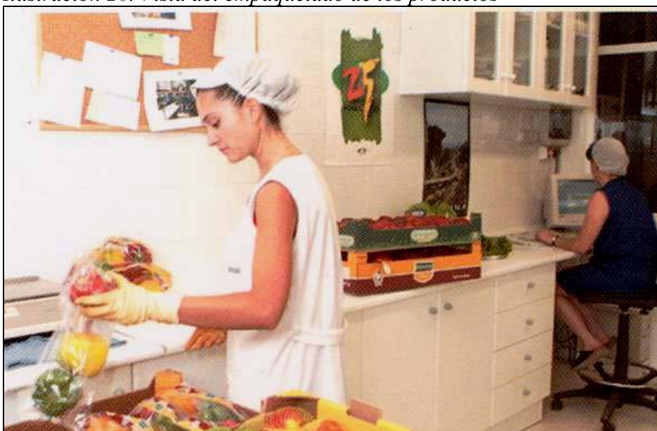
Ilustración 20. Vista del empaquetado de los productos