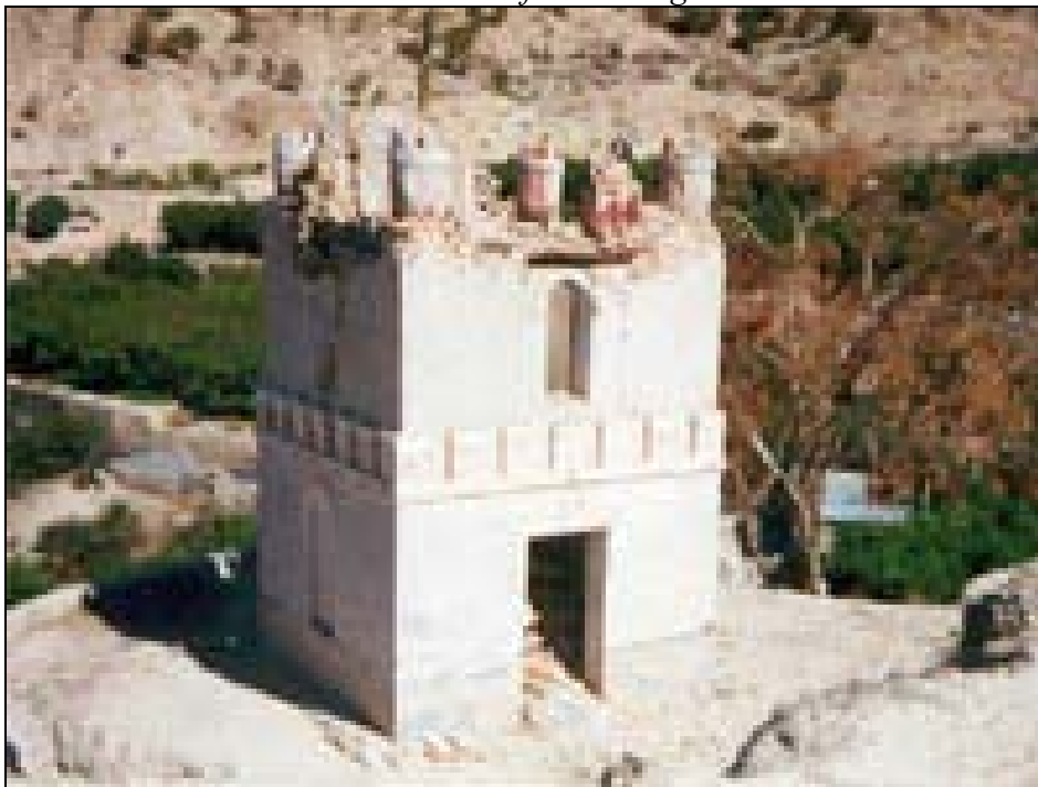
Ilustración 10. Estado inicial del edificio Gurugú de Ulea