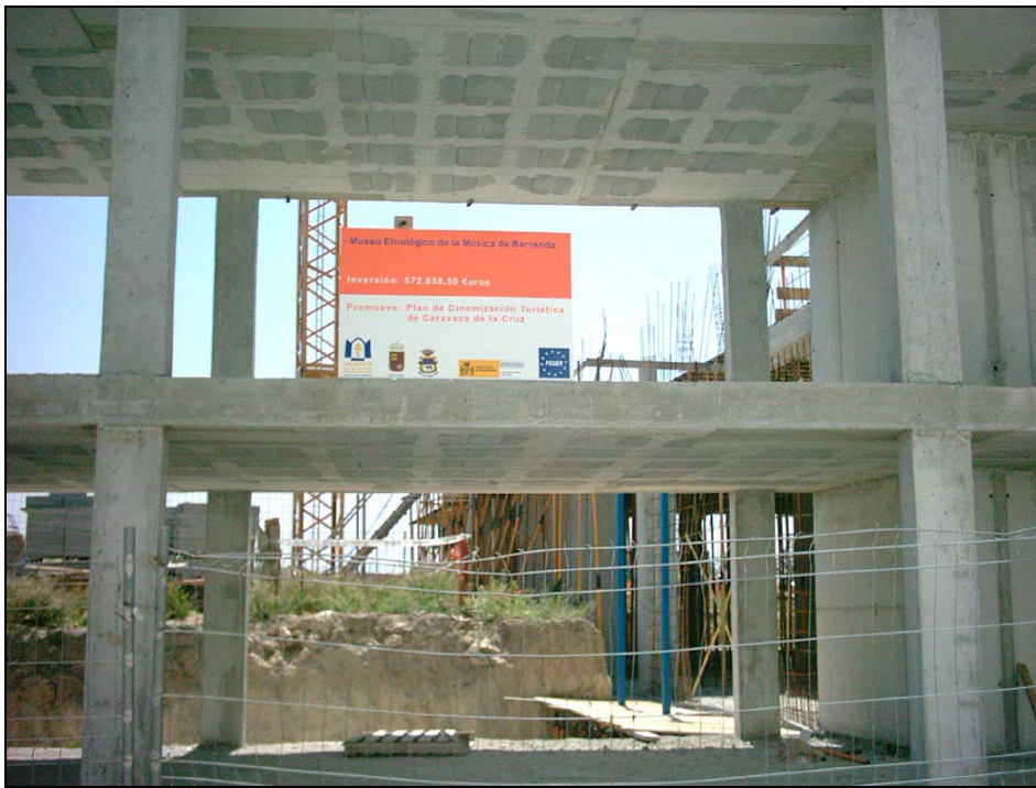
Ilustración 12. Vista del inicio de las obras del Museo Etnológico de la Música de Barranda