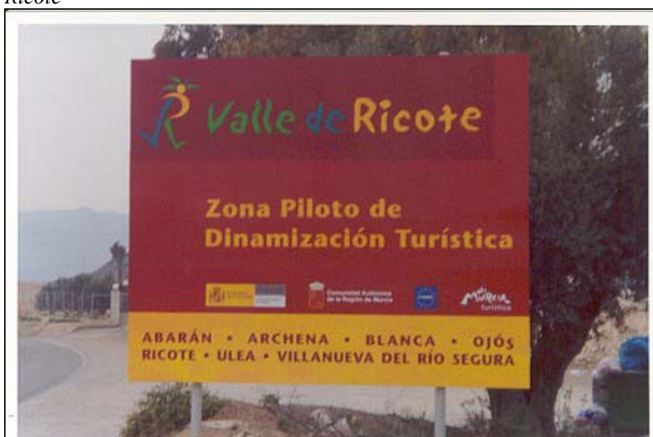
Ilustración 5. Publicidad del Plan de Dinamización turística del Valle de Ricote

Del conjunto de obras y actuaciones que se enmarcan en dicho plan se destacan las siguientes: