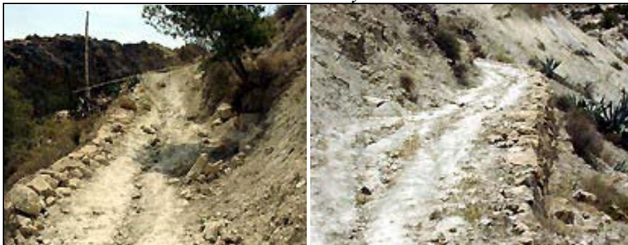
Ilustración 8. Estado inicial de la senda y Mirador del Corazón de Jesús