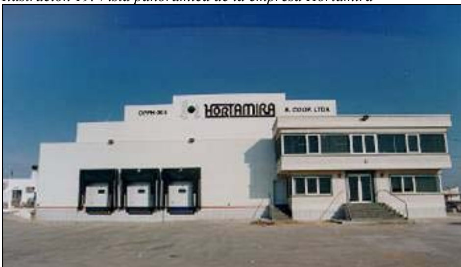
Ilustración 19. Vista panorámica de la empresa Hortamira