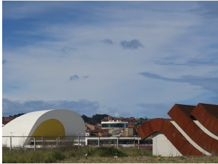
Vista del Escuela Arte y CCI Oscar Niemeyer

Se enmarca en los esfuerzos para mejorar el centro urbano de Avilés mediante la mejora de las infraestructuras, la integración urbana de la ría y la recuperación de antiguos suelos industriales para nuevos usos culturales, educativos y recreativos.