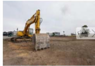
Una pala, ayer, en la parcela donde se construirá la Escuela Superior de Arte. IRMA COLLÍN

Siete años se ha hecho esperar el inicio de las obras para la construcción de la nueva sede de la Escuela Superior de Arte de Asturias, pero finalmente las máquinas han entrado en el solar ubicado en el Parque Empresarial Principado de Asturias (Pepe), cerca del Niemeyer. Según informó ayer la Consejería de Educación y Cultura, el plazo de ejecución de los trabajos es de 20 meses, esto es, tendría que estar finalizado en verano de 2017. Se trata sólo de la primera fase del proyecto, la destinada a acoger a los alumnos de Restauración.