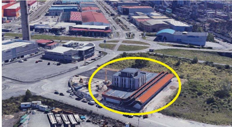
Vista aérea del edificio de la Escuela Superior de Arte

Se trata de un edificio eficiente energéticamente en el que llaman la atención sus grandes ventanales, de suelo a techo, diseño que combinado con la iluminación interior confiere un nivel de luz constante y un aislamiento pensado para conseguir un confort acústico importante, dadas las necesidades especiales del nuevo centro educativo. También destaca la amplitud de sus puertas para facilitar el acceso a piezas de gran formato.