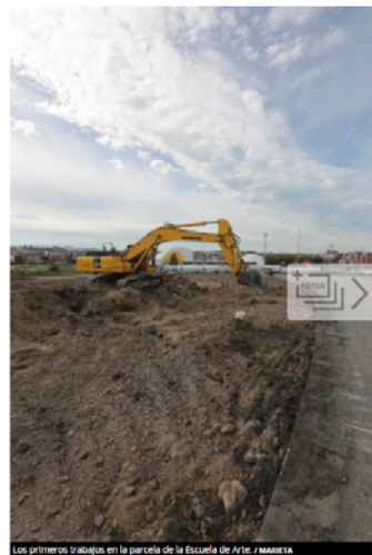
Los primeros trabajos en la parcela de la Escuela de Arte.

La Consejería de Educación y Cultura anunció ayer el inicio de las obras para la construcción de la nueva sede de la Escuela Superior de Arte. Como ya adelantó LA VOZ DE AVILÉS, las máquinas comenzaron a operar la pasada semana en la parcela cercana al Niemeyer que ocupará el nuevo edificio. El Principado cuenta con fondos Feder de la Unión Europea para financiar esta obra, concretamente, según explicaba ayer en una nota de prensa, «el presente contrato está cofinanciado en un 80% por el Fondo Europeo de Desarrollo Regional».