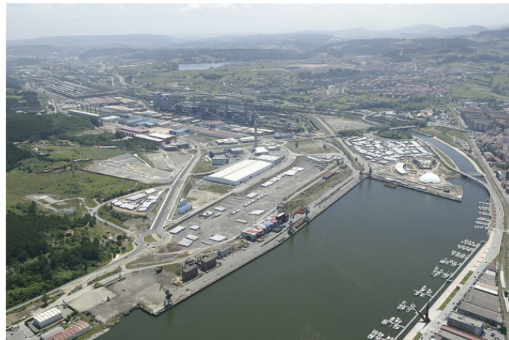
Vista aérea de la ría de Avilés

La ubicación y el diseño del edificio presentan importantes singularidades que se alejan bastante de la tipología de otros centros educativos. En este caso, al tratarse de un edificio de nueva creación y ubicarse en una zona de fuerte presencia industrial, la imagen arquitectónica pretende dialogar con ese entorno. Las formas y colores persiguen de algún modo mimetizarse con ese paisaje industrial que domina la margen derecha de la ría de Avilés.