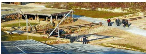
También se ha acondicionado el manantial de Santa Engracia.