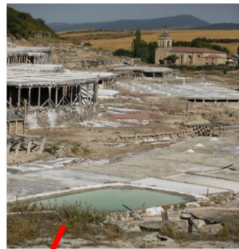
Investigación contra el cambio climático

"Es un laboratorio en medio del valle, de gran interés para investigadores y también para el público en general", ha concluido el diputado general.