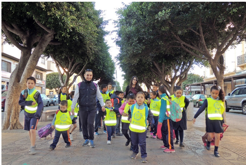
Niños y niñas haciendo uso de los Itinerarios Peatonales Accesibles

escolares, también se aprecian importantes efectos sinérgicos en cuanto a la mejora de la movilidad urbana se refiere, mejora de la accesibilidad de los espacios públicos a través del establecimiento de pasos para patones y aumenta la seguridad en el entorno de las escuelas y las vías de acceso, sin olvidar la gran colaboración establecida entre las distintas Administraciones y la comunidad educativa de Melilla.