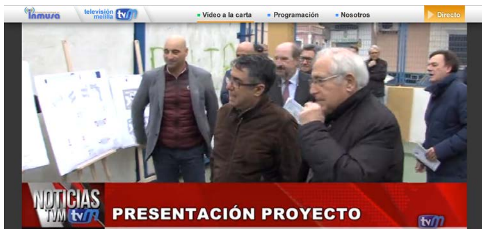
Presentación del Proyecto

Cobertura en TV Melilla del acto de colocación de la primera piedra