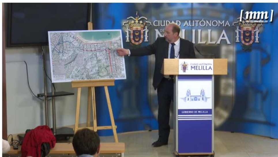
Página web de la Ciudad Autónoma de Melilla