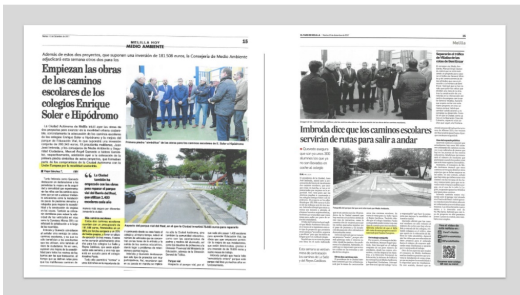
Cartel de obra