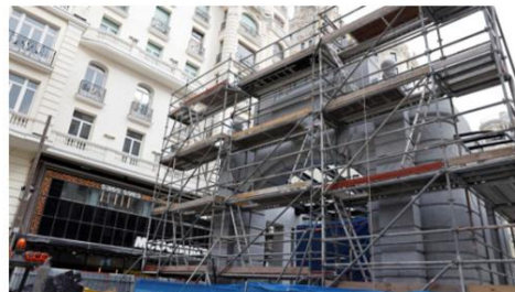
Obras de remodelación en el Metro de Gran Vía.

con LED en las puertas, en el lector sin contacto y en el suelo para informar al viajero sobre el resultado de la validación.