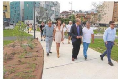
El alcalde, a la izquierda, con otros asistentes a la apertura del parque. PEDRO JESUS MANUEL PANDO