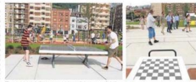
El nuevo espacio incluye mesas para jugar al ping-pong y al ajedrez.

condición «un esmerado proyecto de jardinería que convertirá la vegetación en elemento básico de composición» también una me-