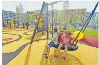
Zona de juegos infantiles del parque de la Mayacina. A la derecha, vista general del nuevo espacio verde más se inaugurado.