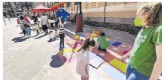
Actividades del Día de Europa en Mieres.