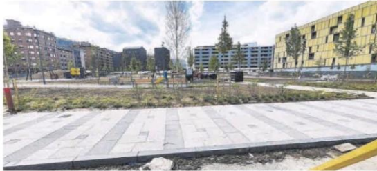
El estado de las obras del parque de la Mayacina, en la mañana de ayer. J.A. Velasco