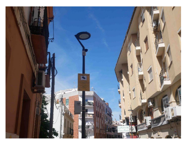
Teniente Miranda Street with Emilio Castelar

The project included the implementation of workstations in the communications room of the Local Police Headquarters, for network management and control, and for the visualization of the videos that are centralized in a municipal CPD located in the La Escuela building.