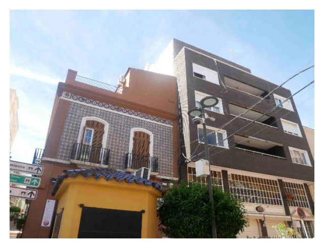
Emilio Castelar Street with Calle Prim