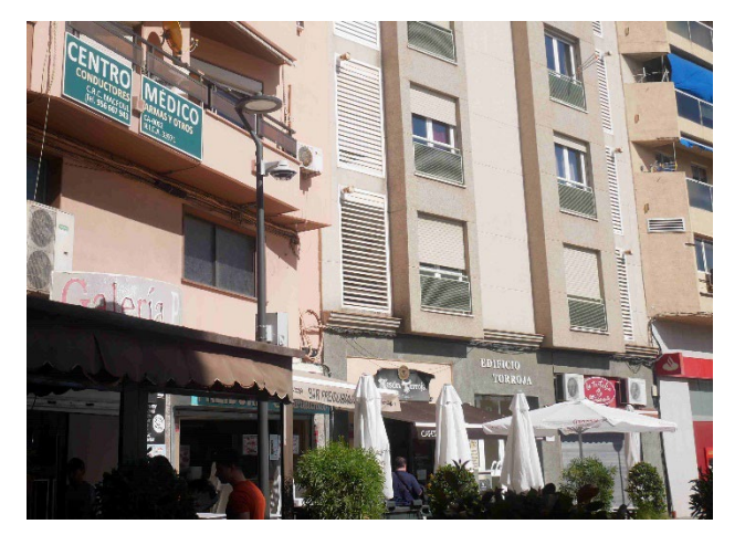
Ingeniero Torroja Market