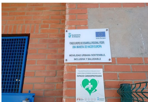
Placas permanentes colocadas en las instalaciones