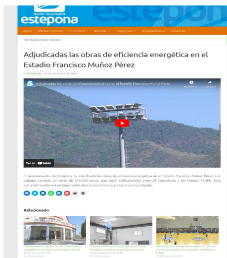
Link del video promocional

https://television.estepona.es/adjudicadas-las-obras-de-eficiencia-energetica-en-el-estadio-francisco-munoz-perez/