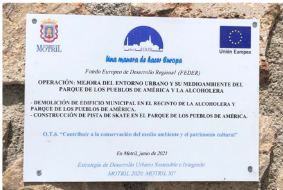
2 Placa Permanente Construcción Pistas Skate Park

En lo relativo a la Comunicación Reglamentaria, se ha colocado durante la realización de los trabajos, carteles informativos de las obras que componen la Operación, conforme se iban ejecutando. Además, tras la finalización de cada uno de los contratos necesarios para la ejecución de la operación, se pusieron placas permanentes.