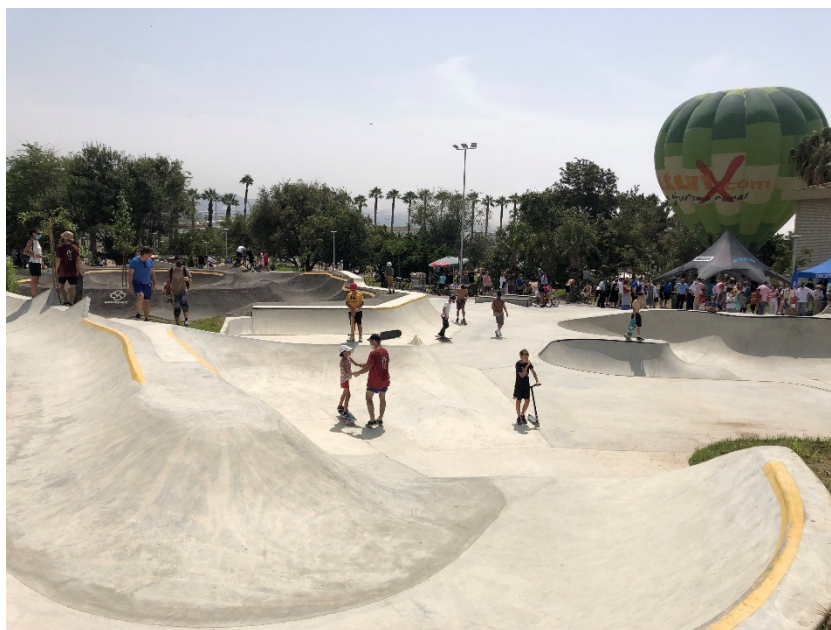
1 Pistas de Skate Park

La actuación ha tenido coste total elegible es de 255.060,23 €, de los que cuales 204.048,18 € son de ayuda procedente del FEDER . La operación tiene un impacto directo en 58.546 habitantes, es decir en toda la población de Motril, ya que es un espacio abierto, de acceso gratuito y ubicado en el centro de la localidad.