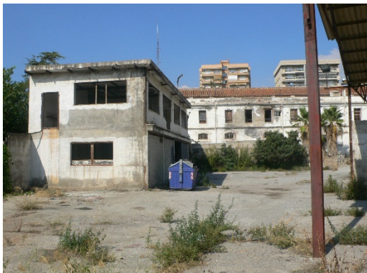
4 Espacio antiguo degradado antes de actuación

Además, con esta actuación se ha mejorado la imagen de la ciudad hacia el exterior, ya que alberga la Oficina de Información y turismo de Motril, lugar donde acuden visitantes y turistas que quieren conocer la ciudad.