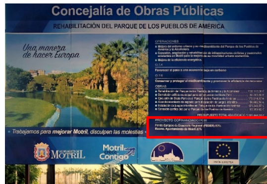
3 Cartel de obra Construcción Pistas Skate Park

Además para dar a conocer a la ciudadanía el papel de los fondos FEDER en la ejecución de la actuación se han llevado a cabo diferentes acciones de comunicación: