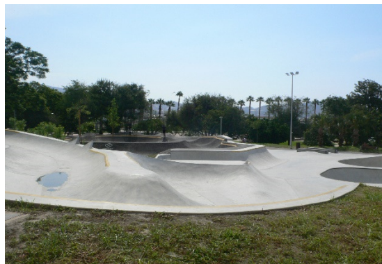
5 Pistas de Skate Park

Por lo tanto con esta actuación se pretende resolver el problema de la falta de espacios dedicados al ocio juvenil así como la puesta en valor de un espacio municipal en desuso.