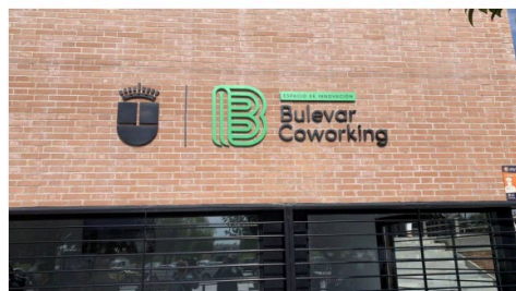
Espacio de Innovación Bulevar Coworking de Alcobendas / Ayuntamiento de Alcobendas

El Espacio de Innovación Bulevar Coworking nace para apoyar proyectos emprendedores y facilitar soluciones de economía sostenible