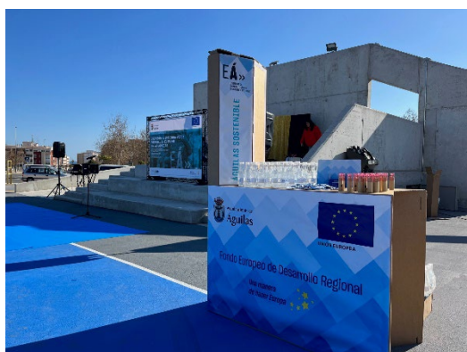
Figura 4. Escenario y stand del evento

Además, el día 3 de marzo del 2023 se llevó a cabo un evento de inauguración con la ciudadanía, al que asistió más de medio millar de personas, en su mayoría familias con niños. Se organizaron numerosas actividades para la ocasión: colchonetas hinchables, pinta caras, taller de pulseras y globoflexia, palomitas de maíz y algodón de azúcar. Asimismo, tuvo lugar la actuación teatral 'El regalo de la abuela', interpretado por la compañía Imagine Teatro y Ocio, que consiguió arrancar las carcajadas de grandes y pequeños.