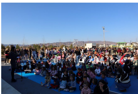
Figura 5. Participantes en el evento

Además se regaló merchandising a los asistentes, que consistió en una mochila, un set de lápices de colores y una chapa.