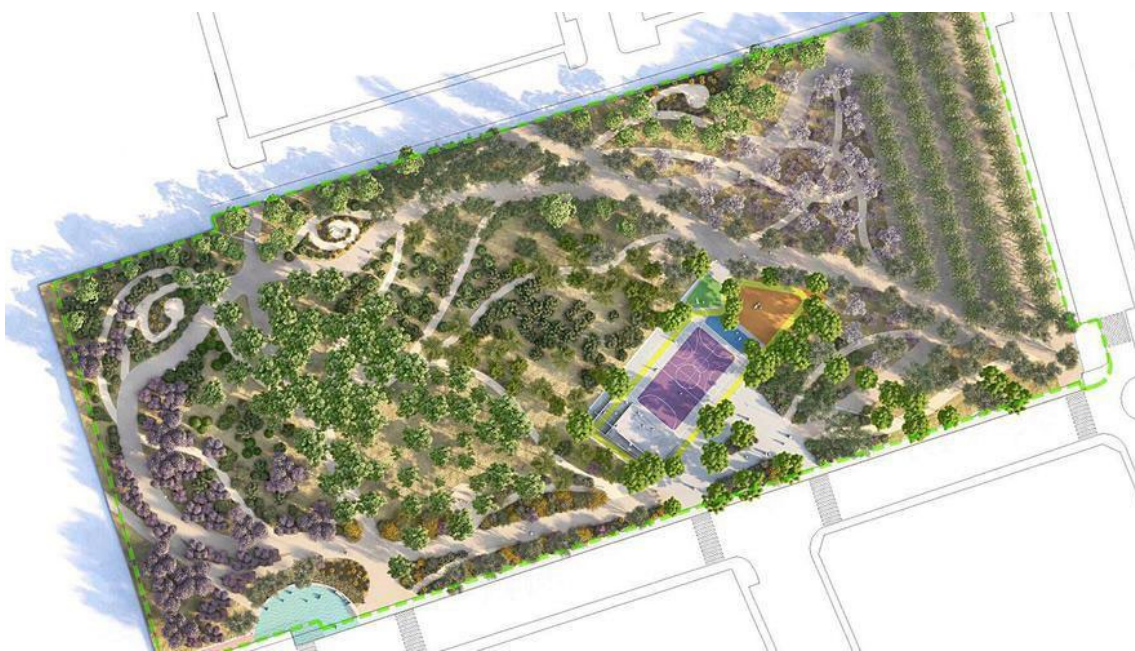
Figura 1. Infografía del Parque de las Acacias

La intervención incluye, entre otros, recorridos peatonales (para andar o correr) y bicicleta, una pista polivalente de deportes, un escenario para eventos, pantalla de cine de verano, juegos infantiles, área de parkour, explanadas para mercadillos o prácticas de ejercicios colectivos bajo un bosque de moreras y un área de picnic bajo unos almendros. Asimismo, se han creado tres miradores desde el que se pueden ver lugares tan emblemáticos de la localidad como la Chimenea de la Loma, la Torre de las Palomas y el Castillo San Juan de las Águilas.