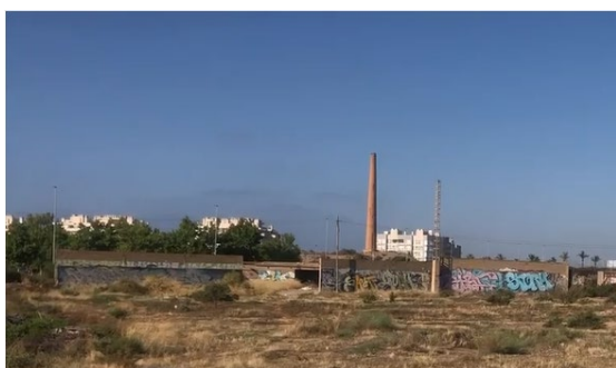
Figura 10. Espacio antes de la intervención

Después de la actuación, se recupera ese espacio degradado y se dota al municipio de mayor cobertura arbórea y se plantan, entre otros, moreras y almendros. Asimismo, estas especies comportan reducidos costes de gestión; ya que se crea un sistema de riego por goteo, que se nutre de agua procedente de la estación depuradora de aguas residuales municipal.