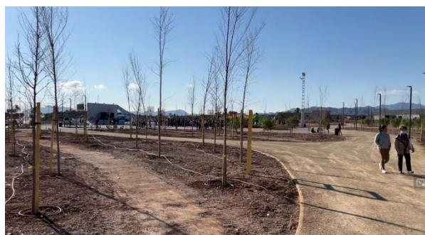
Figura 9. Parque después de la intervención

Así mismo, amén del embellecimiento del municipio, otro de los objetivos que consigue esta actuación es la de conectar las zonas de expansión de Águilas con el núcleo urbano.