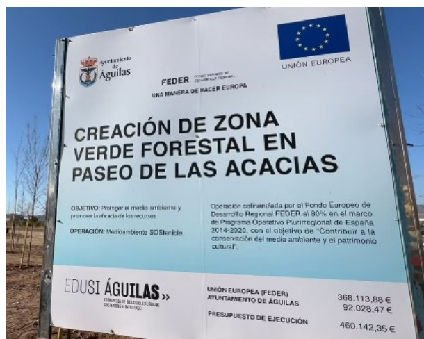
Figura 2. Cartel temporal de obra

Durante la ejecución de las obras se instaló un cartel temporal , con el fin de resaltar el papel clave de los fondos FEDER para la ejecución de la actuación. Así mismo, al finalizar las obras se ha colocado una placa permanente , en el principio del paseo.