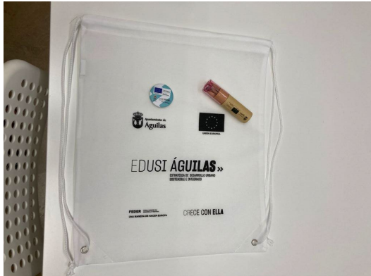
Figura 6. Merchandising repartido