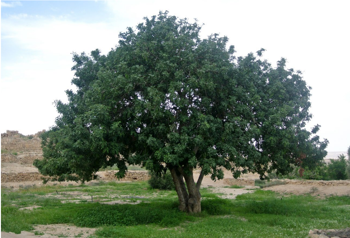
Figura 8. Foto de especie autóctona plantada: Algarrobo ( Ceratonia siliqua )

La propuesta del Consistorio implementa un nuevo modelo de gestión del arbolado urbano basado en los principios de la arboricultura moderna, que permiten reducir los costes de agua y de podado, liberando el resto del presupuesto para nuevas plantaciones, mantenimiento, y para asegurar la salud vegetal.