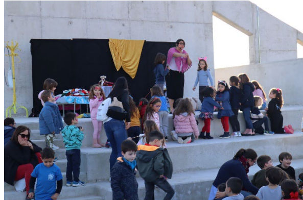
Figura 7. Obra de teatro

En definitiva, se ha llevado a cabo una intensa labor de difusión de la actuación, reflejando que se ha cofinanciado por el Fondo Europeo de Desarrollo Regional FEDER al 80%, en el marco del Programa Operativo Plurirregional de España POPE 2014-2020.