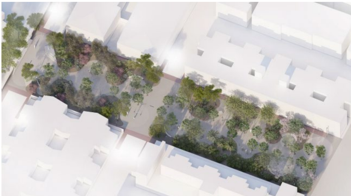
Figura 12. Recreación de la intervención en la Plaza de Mocada i Reixac

Además, establece un enfoque integrado para naturalizar la ciudad y mejorar el ecosistema urbano, lo que hace que se creen sinergias con otras intervenciones del mismo objetivo temático, dentro de la EDUSI Águilas SOSostenible, como la plaza de Moncada i Reixac o el de Gutiérrez Mellado.