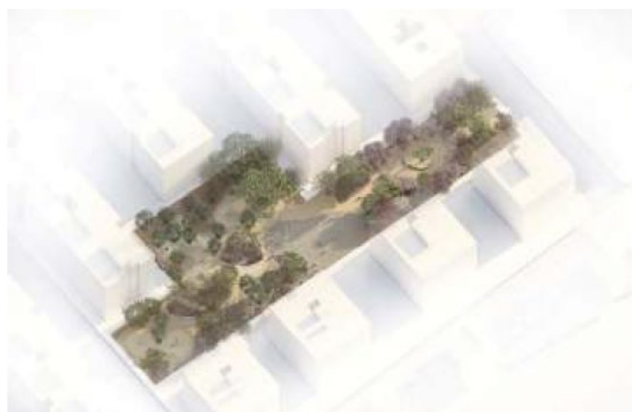
Figura 13. Infografía del proyecto de remodelación de la plaza Gutiérrez Mellado

La actuación para la mejora de la plaza de Moncada i Reixac tiene como objetivo aumentar su arbolado a través del plantado de especies autóctonas, solucionar los problemas de accesibilidad, eliminar pavimentos no drenantes y renovar el equipamiento para convertirla en un lugar de encuentro para la población juvenil. Sigue la filosofía de esta buena práctica y la expande al centro urbano de Águilas.