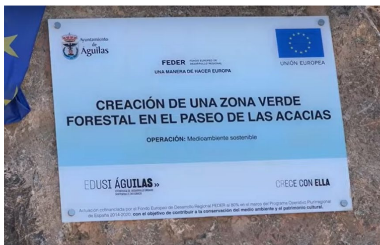
Figura 3. Placa permanente

Se han realizado diversas publicaciones en la web de la EDUSI, así como, a través de las redes sociales: