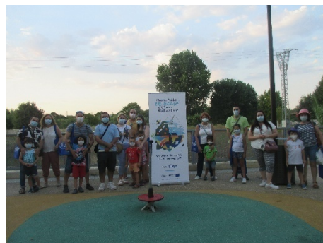
ENCUENTRO CON LA CIUDADANÍA PARA DAR A CONOCER LA IMPORTANCIA DE LA COFINANCIACIÓN EUROPEA PARA PONER EN MARCHA ESTE PROYECTO