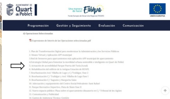
PORTAL WEB ÚNICO

En los folletos informativos sobre las acciones en el barrio Río Turia se incluyó esta acción.