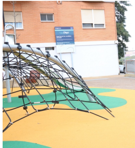
CARTEL INFORMATIVO DE LA OBRA