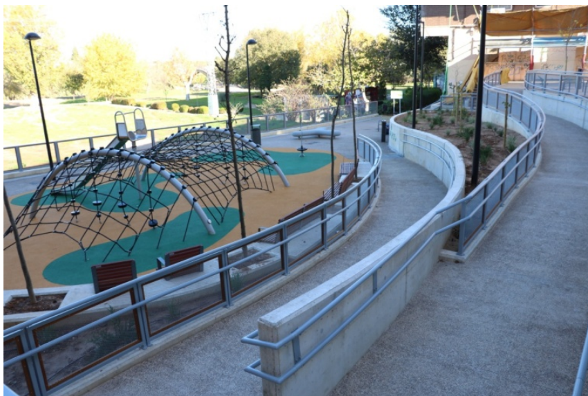
IMAGEN DE LA ACTUACIÓN COMPLETADA. AL FONDO, EL PARQUE FLUVIAL DEL RÍO TURIA

La actuación financiada ha permitido convertir un solar sin uso y degradado en un Parque para uso y disfrute de la ciudadanía de todas las edades, consiguiendo que haya recuperado su valor estratégico. Allí se han instalado juegos infantiles, bancos para el descanso, vegetación y arbolado para proporcionar sombra. Asimismo, se ha abierto una nueva entrada al espacio natural del río Turia, con una amplia rampa para que peatones y ciclistas puedan acceder al recorrido del cauce. Por último, se han instalado farolas con luminarias tipo led para favorecer el ahorro energético.