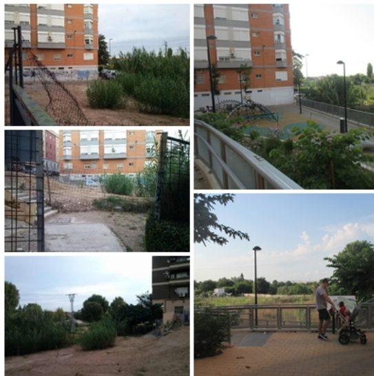
EL ÁREA DEGRADADA SE HA CONVERTIDO EN UN ESPACIO AGRADABLE Y SOSTENIBLE

Con la actuación se ha conseguido el objetivo de difundir y poner en valor el patrimonio natural y cultural de la zona y potenciar sus posibilidades para el aprovechamiento turístico. También se ha logrado transformar un espacio degradado y sin uso para dar paso a un área agradable y accesible a los vecinos y vecinas.