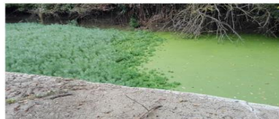
Foto 1. Aspecto del emplazamiento de MYRIOPHYLLUM AQUATICUM , arroyo sin nombre, Lopidana.