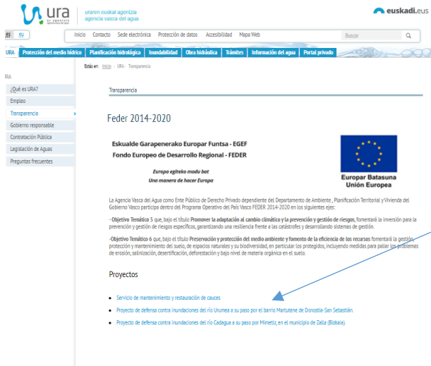
Apartado web URA

https://www.uragintzia.euskadi.eus/u81-000312/es/contenidos/informacion/feder_2014_2020/es_def/index.shtml