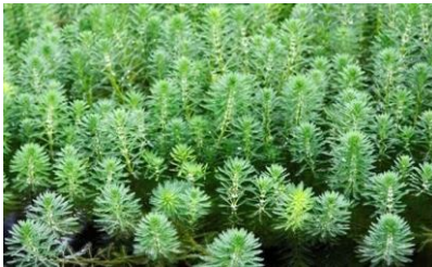
Foto 2. Aspecto del emplazamiento de MYRIOPHYLLUM AQUATICUM , arroyo sin nombre, Lopidana.

El coste elegible es de 13.883,54 euros, de los cuales un 50% (6.941,77 €) están cofinanciados por el FEDER.