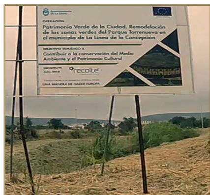
Cartel de obra

El papel del FEDER en la actuación ha sido convenientemente difundido entre los beneficiarios/as, beneficiarios/as potenciales y el público en general, además de en el cartel informativo de los trabajos se ha reseñado la cofinanciación del FEDER, logos y slogan en los informes, pliegos, proyectos, etc.