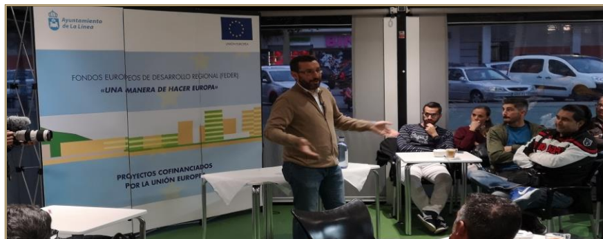
Café con el Alcalde

Siendo conscientes de la transformación, tanto visual como social, que iba a sufrir la zona de actuación, se optó por la realización de un video “Time Lapse” de todo el proceso de ejecución, quedando evidentemente demostrado este sustancial cambio en el entorno. Este video ha sido difundido por redes sociales, whatsapp y youtube, teniendo un grado alto de difusión, llegando a tener aproximadamente 4.000 reproducciones en Facebook en menos de 24 horas de ser publicado.