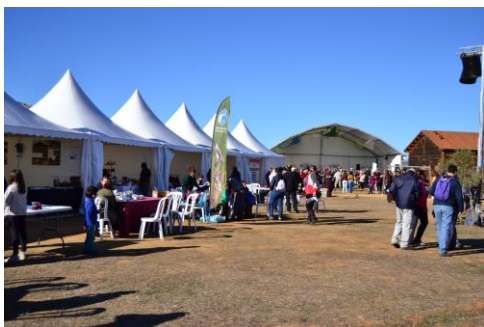
1.- ZONA DE CARPAS