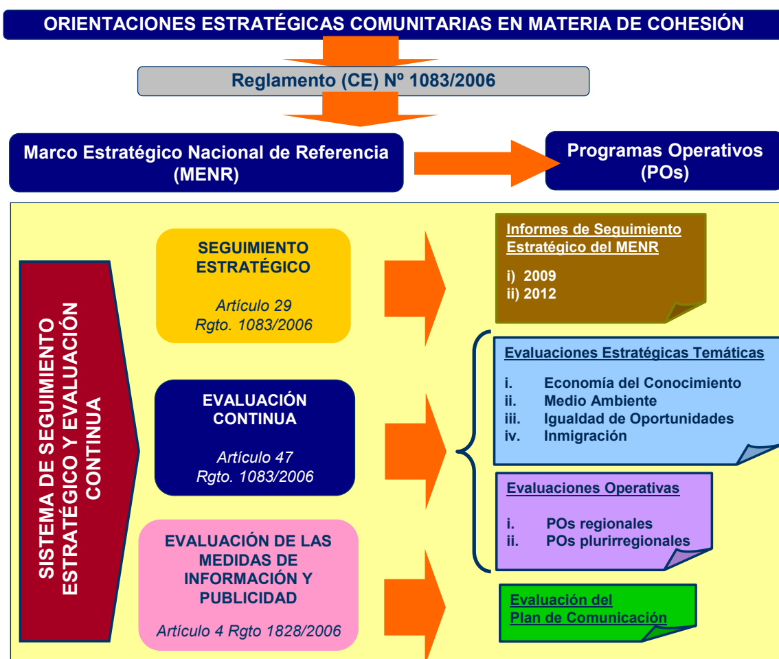
Esquema 1. Periodo de Programación 2007-2013. Seguimiento Estratégico y Evaluación Continua.

En el marco de los compromisos adquiridos por las Autoridades de Gestión de los Fondos (FEDER, FC y FSE), el presente documento constituye una guía para establecer un marco común de trabajo y unas orientaciones metodológicas para abordar los retos y requerimientos comunitarios en materia de seguimiento estratégico.