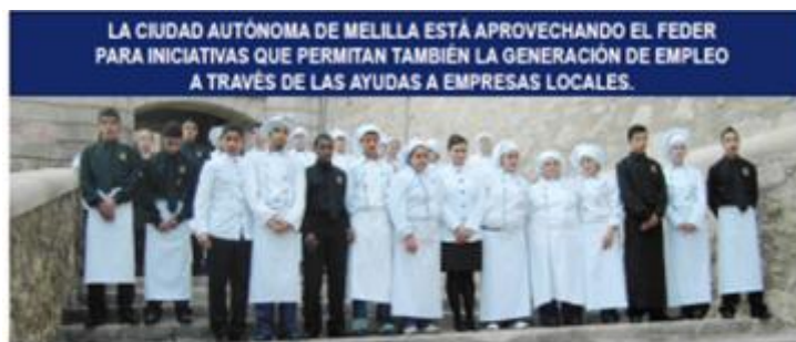
Foto de participantes de acciones cofinanciadas,

La incorporación de criterios de Igualdad de Oportunidades , tanto por la naturaleza y contenido de la actuación, como por los canales de divulgación seleccionados. Se ha empleado un lenguaje sencillo e inclusivo para poder llegar al público más amplio posible, y se han incluido fotografías de participantes de acciones con un equilibrio entre el número de hombres y mujeres (en consonancia con las propias actuaciones reflejadas). Se eligió la sede de la Viceconsejería de la Mujer, perteneciente a la Consejería de Educación y Colectivos Sociales, como uno de los emplazamientos para la distribución de ejemplares. Además, su disponibilidad desde la web de Fondos Europeos de la Dirección General de Fondos Europeos asegura la accesibilidad en condiciones de igualdad.