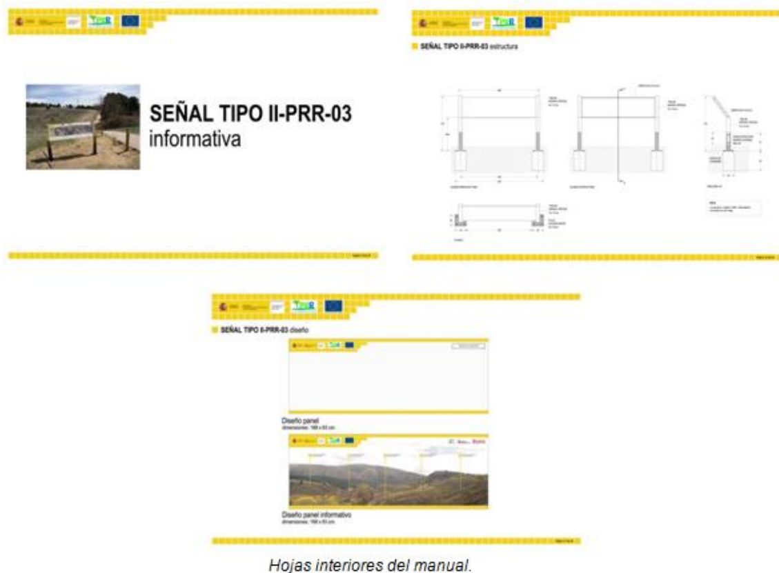
Hojas interiores del manual.

En cuanto al alto grado de cobertura sobre la población objetivo de la acción de comunicación , señalar que se ha alcanzado un grado de cobertura del 100% sobre el conjunto de los destinatarios de dicho manual, responsables de la gestión de los Fondos Europeos de la Confederación Hidrográfica del Duero y responsables de la gestión de las actuaciones cofinanciadas con Fondos Comunitarios, dado que todos y cada uno de estos responsables poseen un ejemplar del manual, tanto en papel como en formato digital.