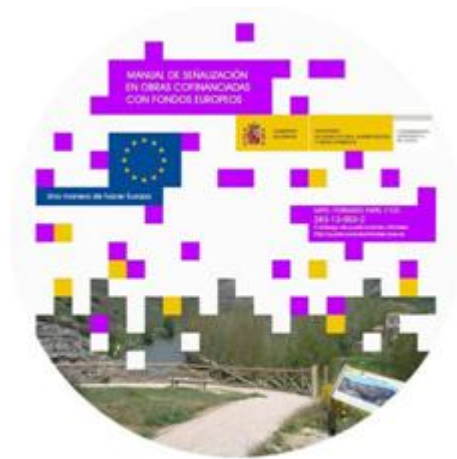
Carátula del CD del manual.