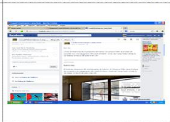
Publicación en Facebook