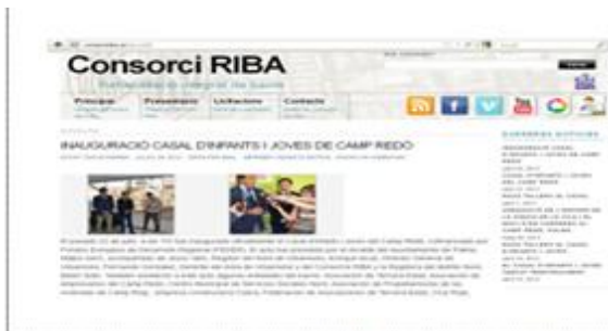
Noticia Web Consorcio RIBA

Para mejorar la difusión y hacer extensiva la comunicación al resto de la población, la noticia de la inauguración se hizo extensiva a las redes sociales, incluyendo la noticia en las páginas web del Consorcio RIBA ( www.consorciriba.es y www.urbancampredo.com ), facebook y la página web del Ayuntamiento de Palma ( www.a-palma.es ).