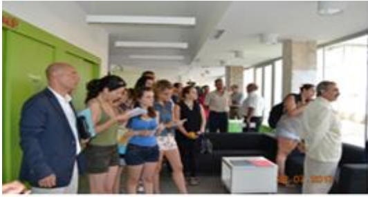
Sala Polivalente del Casal