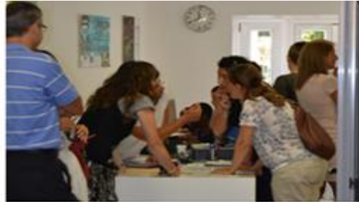
Recepción del Casal

Uso de nuevas tecnologías de la información.