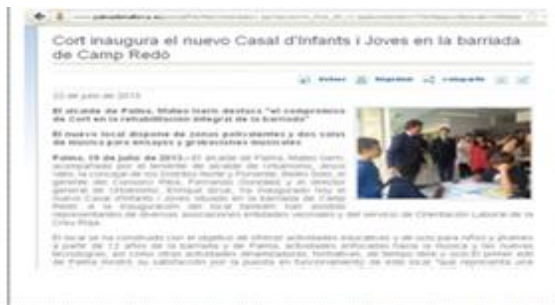
Noticia Web Ayuntamiento de Palma