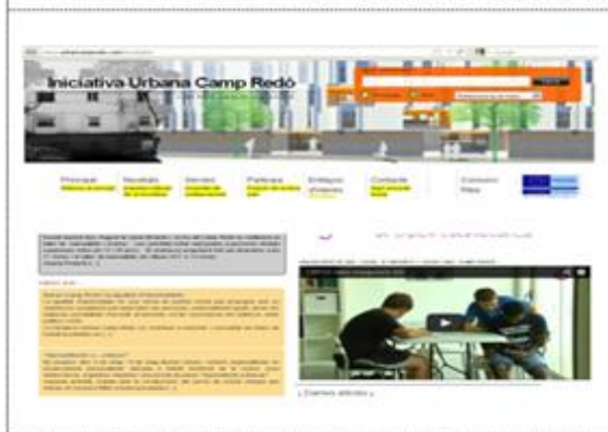
Noticia Web Urban Camp Redó