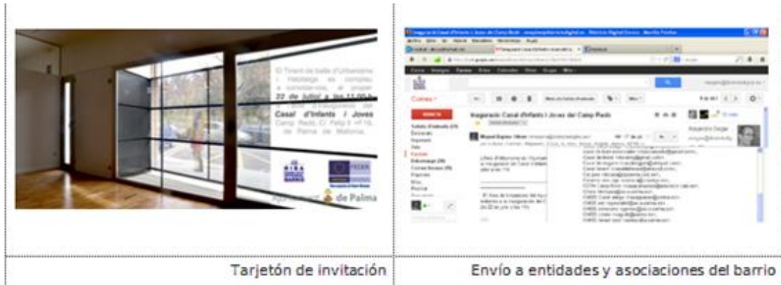
Tarjetón de invitación