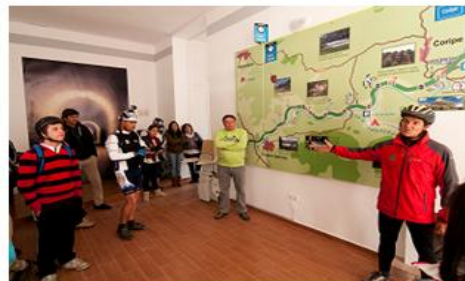
Fotografías de Ruta en bicicleta por la Vía Verde de la Sierra

La Vía transcurre a lo largo de 36 kilómetros por el antiguo trazado ferroviario Jerez-Almargen, entre las provincias de Cádiz y Sevilla. Se trata de un recurso medioambiental y motor de desarrollo socioeconómico para la región, que está dominada por la influencia de los ríos Guadalete, Guadalporcún y, en la parte