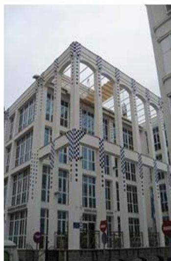
Derecha: 1er premio, categoría C (12-14 años). Fotografía: "Centro de la Mujer"