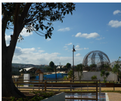
Izquierda: 1er premio, categoría A (8-9 años) Fotografía: "Ordenación de los terrenos de la Granja, 2ª fase"

Resultados del concurso. Las fotografías premiadas versaron sobre los siguientes proyectos o actuaciones cofinanciadas por la Unión Europea: Ordenación de los terrenos de la Granja 2ª fase, Remodelación de la Torre de la Vela para Museo Español Moderno y Contemporáneo, Conservación más mantenimiento y gestión medioambiental en playas, Remodelación del Parque Hernández, Prolongación del vial Escultor Mustafa Arruf, Centro de la Mujer, y Centro de Salud con gerencia de atención primaria y banco de sangre.