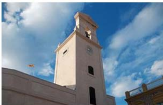
Arriba: 1er premio, categoría B (10-11 años). Fotografía: "Remodelación de la Torre de la Vela para Museo Español Moderno y Contemporáneo".

Por la adecuación de los contenidos a los objetivos perseguidos , ya que se buscaba llegar a un segmento muy concreto de la población -niños entre 8 y 14 años- a través de un recurso sencillo pero, a la vez, altamente gráfico e instructivo, como es la fotografía, e incentivándolo a través de premios.