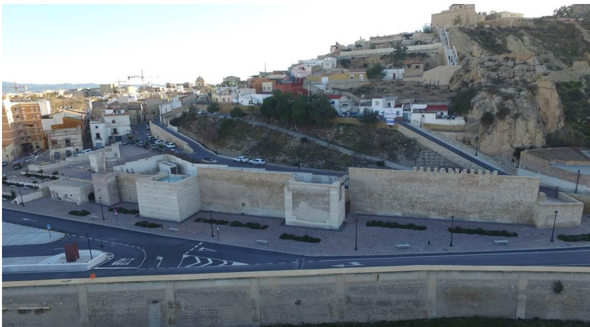
Imagen del conjunto de la zona finalizadas las actuaciones

Se han usado especies arbustivas de dos tipos: por un lado, arbustos aromáticos de sotobosque (jara, romero, tomillo y lavanda) y por otro lado, de flor abigarrada y vitalista (bugambillas, ibiscum, margaritas, rosales, etc). También se proyectan especies arbóreas: pino piñonero, olivos y cipreses, como soluciones típicas de laderas mediterráneas y gran raigambre cultural, y ocasionalmente árbol del amor para crear puntos de sombra fresca y contrapunto de decidido cromatismo. Todas las especies cuentan con sistema de riego por goteo. En los pies de los taludes se tiende un colector de drenaje, en el caso que la ladera vierta aguas contra muros o viviendas.