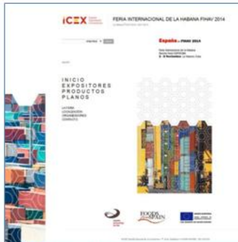
(Catálogo online) contraportada y portada)