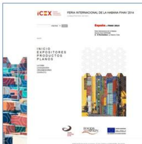
(Catálogo online) contraportada y portada)