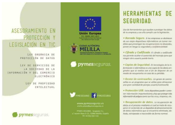
Información sobre las acciones de Protección y Legislación en TIC y de Promoción de la Confianza Digital entre la ciudadanía