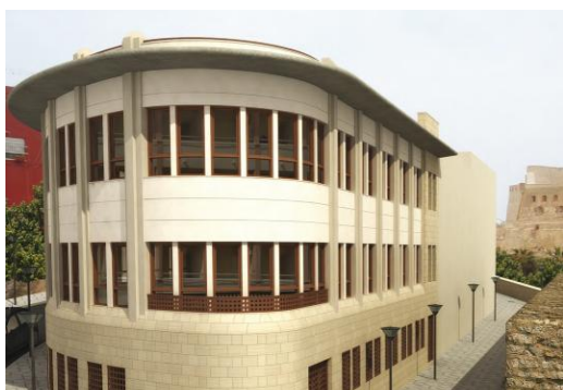
Recreación inicial y fotografía comparadas. Cabecera del edificio orientada al Sur.

Después de cumplir diversos procedimientos relacionados con el hallazgo de restos cuyo interés arqueológico fue finalmente descartado, y de superar determinados imprevistos de otra índole, el proyecto fue materialmente finalizado y ha sido recientemente inaugurado, concretamente el 13 de marzo de 2015.