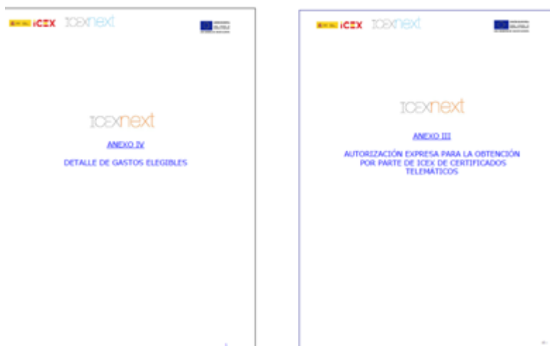
(Detalle diversos documentos del programa)