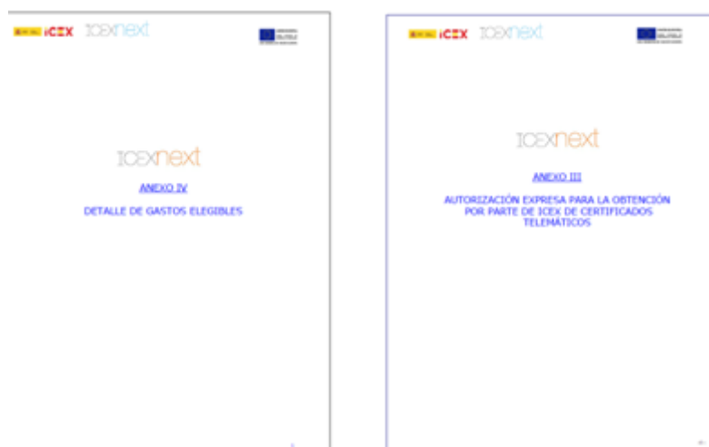
(Detalle diversos documentos del programa)

Esta actuación contribuye claramente a los objetivos que ICEX tiene asignados como Organismo Intermedio dentro del Programa Operativo, incentivando y/o consolidando el crecimiento internacional de las PYMES españolas, principalmente no exportadoras o exportadoras ocasionales.