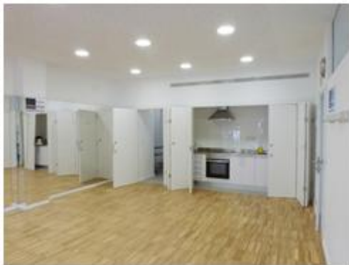
Sala 2 equipada con cocina y espejos.

La licitación de las obras incluyó, como mejoras funcionales puntuables, los equipamientos de diferentes espacios del Casal así como la contratación de actividades. La empresa constructora dotó la sala de ensayo con equipamiento musical, y aportó varios electrodomésticos como un televisor, nevera y microondas. Así mismo suscribió un contrato con una empresa para la realización de talleres en el Casal durante todo el 2013.