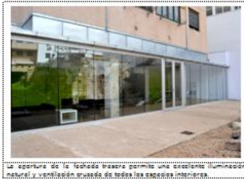
La apertura de la fachada trasera permite una excelente iluminación natural y ventilación cruzada de todos los espacios interiores.

Tanto el edificio como los espacios exteriores están adaptados para personas discapacitadas. Los accesos tienen las dimensiones adecuadas y todas las puertas y accesos son accesibles. Los baños permiten el uso y maniobra independiente por parte de personas en silla de ruedas, contando con las ayudas correspondientes para la transferencia a sanitarios. Las puertas incorporan señales braille. El proyecto cumple íntegramente con el decreto 110/2010 de accesibilidad y supresión de barreras arquitectónicas.