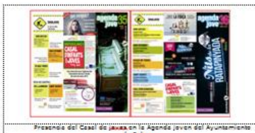
Presencia del Casal de Joves en la Agenda Jove del Ayuntamiento de Palma.

- Mensualmente se publican en la "Agenda Jove" de la Regiduría de Juventud del Ayuntamiento de Palma las actividades del Casal. Esta revista se distribuye entre servicios y entidades juveniles de la Ciudad de Palma.