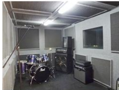
Cabina de ensayo musical equipada con amplificadores, equipo de voces y batería.

También consideramos como línea innovadora la promoción de la “autogestión de las actividades” por parte de la población infantil y juvenil. Para ello el Casal ofrece sus diferentes espacios polivalentes para que sean los propios jóvenes los responsables de dinamizar y gestionar su tiempo libre.