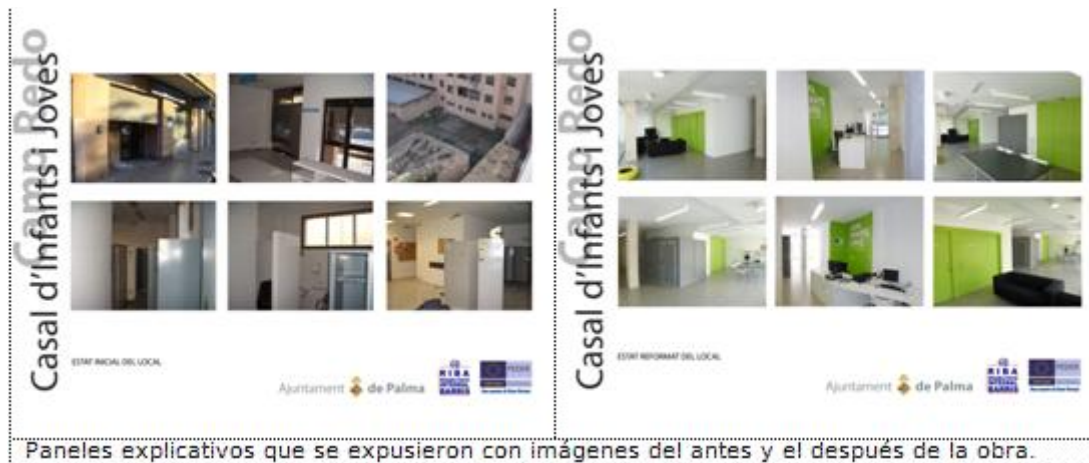
Paneles explicativos que se expusieron con imágenes del antes y el después de la obra.

Señalar que este apartado queda extensamente ilustrado en el informe de buenas prácticas de comunicación de la apertura del Casal de Joves. La inauguración contó con una notable difusión en los medios de comunicación, tanto prensa como televisión en los que se refirieron a la financiación FEDER.