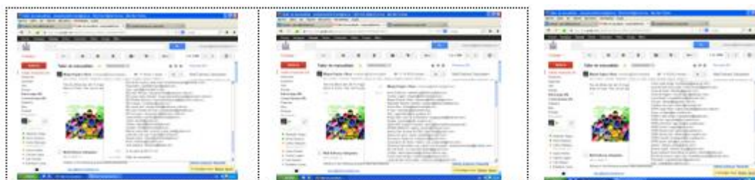
Envío de correos electrónicos con información de actividades.

- Se han llevado a cabo difusiones a través de envíos de correos electrónicos informativos sobre la apertura a entidades y servicios (resto de Casales Municipales, Colegios, Institutos, Asociaciones de Vecinos, Centro Municipal de Servicios Sociales Nord, Parroquia San Francisco de Paula, etc.). Se mantiene un envío mensual donde se les informa de toda la oferta de actividades.