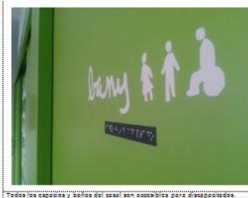
Todos los espacios y baños del Casal son accesibles para discapacitados.

Tanto el edificio como los espacios exteriores están adaptados para personas discapacitadas. Los accesos tienen las dimensiones adecuadas y todas las puertas y accesos son accesibles. Los baños permiten el uso y maniobra independiente por parte de personas en silla de ruedas, contando con las ayudas correspondientes para la transferencia a sanitarios. Las puertas incorporan señales braille. El proyecto cumple íntegramente con el decreto 110/2010 de accesibilidad y supresión de barreras arquitectónicas.