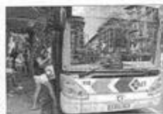
El nuevo seguro de la EMT podrá ser objeto de posterior revisión.