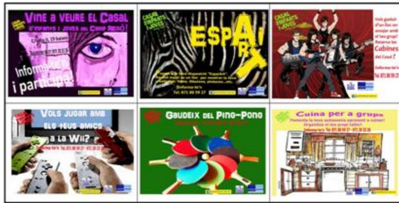
Carteles sobre la cesión de espacios para actividades.

Este hecho hace que se incorporen y se conecten, por tanto, aspectos relacionados con educación, prevención de conflictos y delincuencia, tiempo libre, formación para el empleo, arte, danza, música, habilidades sociales, ocio, cultura, patrimonio histórico y nuevas tecnologías entre otros. Todo ello se hace en un entorno contenido, donde los usuarios y sus familias establecen relaciones directas con los profesionales del área social y que permite un trabajo cercano con los entornos familiares.