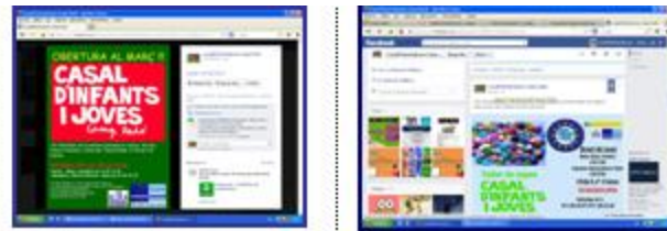
Captures de pantalla del Facebook del Casal. Febrero y junio de 2018.

- Con la finalidad de atraer a los usuarios hacia las diferentes actividades que se llevan a cabo, se diseñan carteles y banners específicos para cada evento.