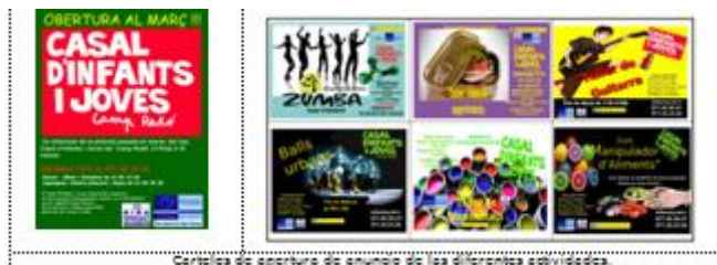
Carteles de apertura de anuncio de las diferentes actividades.

- Con la finalidad de atraer a los usuarios hacia las diferentes actividades que se llevan a cabo, se diseñan carteles y banners específicos para cada evento.