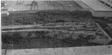
En una segunda fase se está realizando los los restos de la Acopla Real, obra que se está realizando en Camp Redó.