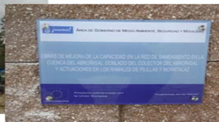
Placa permanente en jardín sobre zona pozo de ataque