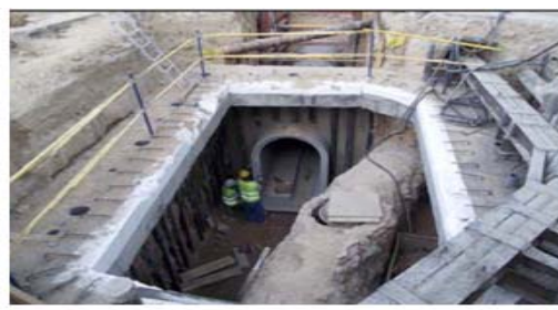
Conexión de colector nuevo con primitivo de Moratalaz