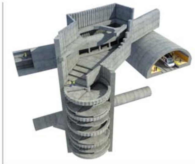
Conexión nuevo colector B con colector B primitivo Abroñigal