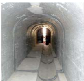
Vista interior del colector de Moratalaz y reposición exterior con arbustos y arbolado