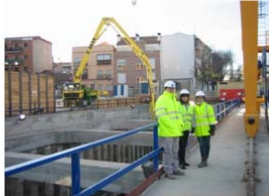
Separación de residuos en obra del pozo de extracción imágenes de parte del equipo durante las obras

Este proyecto no requiere sometimiento a ningún procedimiento de evaluación ambiental según lo establecido en la Ley 2/2002, de 19 de Junio, de Evaluación Ambiental de la Comunidad de Madrid, dado que todos los tramos de colector se sitúan en zonas urbanas y ninguno de ellos afecta a espacios del Anexo IV, no se encuentra recogido en ninguno de los epígrafes de los Anexos de la ley 2/2002.