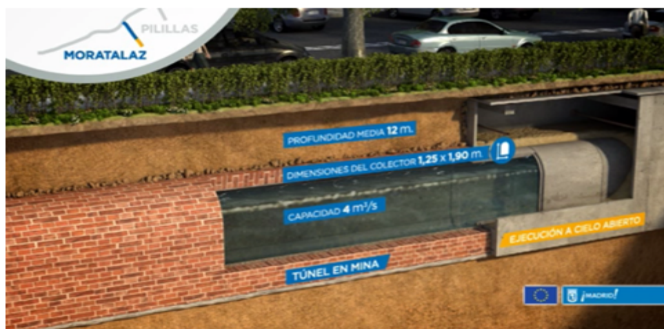
Vista interior del colector de Moratalaz y reposición exterior con arbustos y arbolado

El nuevo colector de 661,87 m. se ha ejecutado paralelo al colector primitivo de la cuenca de Moratalaz, bajo la calzada, hasta entroncar con el colector B existente a la altura del Nudo de la A-3 con la M-30. Recoge hasta 4,0 m 3 /s en avenida del colector existente mediante un aliviadero lateral ejecutado en la pared del mismo, y las deriva hasta el nuevo doblado del colector B