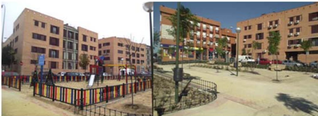
Reposición y creación de espacios sobre área afectada por el pozo de ataque de tuneladora

En todo caso se han observado las medidas medioambientales adecuadas y requeridas durante la ejecución de las obras y al finalizar las mismas, se ha llevado a cabo la reposición de las zonas afectadas durante la ejecución de las obras mediante revegetación y creación de nuevos espacios para la ciudadanía. El coste de Adecuación Ambiental ha ascendido a 37.136,59 €.