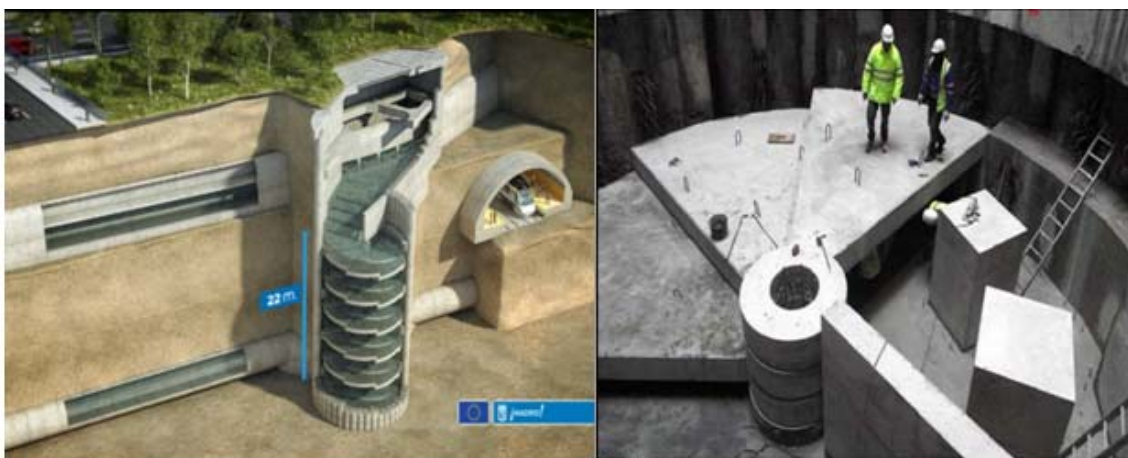
Conexión nuevo colector B con colector B primitivo Abroñigal