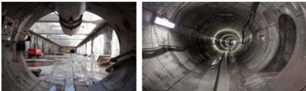
Vistas del pozo de ataque de la tuneladora y túnel terminado del doblado colector B Abroñigal

El Doblado del Colector B de Abroñigal en 2.398,87 m se han llevado a cabo mediante excavación con tuneladora, con una máquina tuneladora (MP 155-SE de LOVAT), siendo el diámetro exterior de excavación del túnel de 3,95 m y estando constituido el revestimiento por anillos de dovelas prefabricadas de hormigón armado de 1,20 m de longitud y 0,20 m de espesor. El diámetro interior del colector es de 3,40 m. Con la sección proyectada este colector es capaz de recoger hasta 41 m 3 /s a sección completa sin entrar en carga.