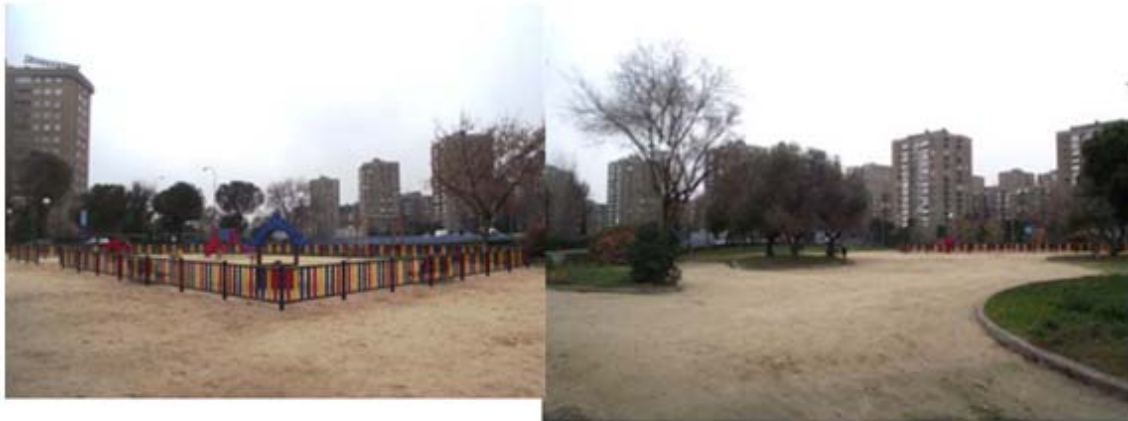
Reposición de área afectada sobre conexión colector B Abroñigal primitivo