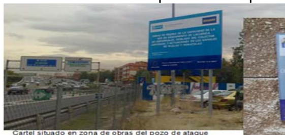
Cartel situado en zona de obras del pozo de ataque