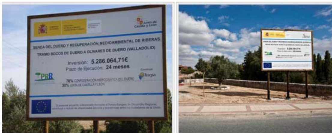
Cartel de obra de la actuación de la Senda del Duero.

contribuye a reducir las disparidades sociales y económicas entre los ciudadanos de la Unión” y el emblema de la Unión Europea.