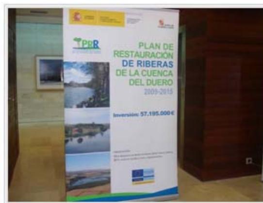
Roll-up empleado durante el acto de presentación.

En este acto se colocó una trasera divulgativa de la actuación y un roll-up del II Plan de Restauración de Riberas al que pertenece la Senda del Duero. En los diseños de ambos carteles se incluyó el logo , proporcionado por la Dirección General de Fondos Comunitarios del entonces Ministerio de Economía y Hacienda, para los documentos promocionales del Fondo Europeo de Desarrollo Regional, y que ha sido adaptado por el Organismo de cuenca.