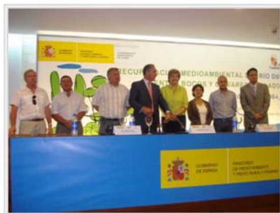
Acto de presentación de la actuación.