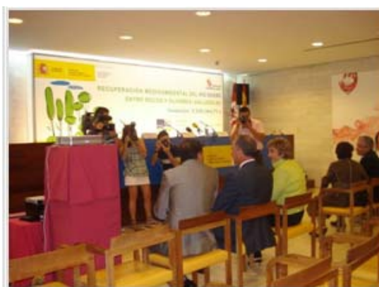
Acto de presentación de la actuación.