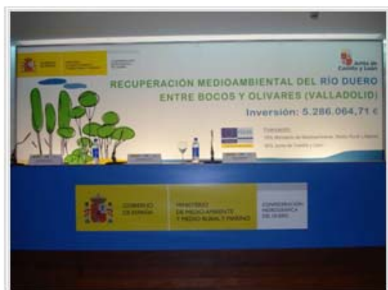
Trasera utilizada en el acto presentación de la actuación.

lugar en las dependencias del Museo Provincial del Vino, ubicado en el castillo de Peñafiel (Valladolid). Ha dicho acto asistieron los alcaldes y vecinos de las localidades por las que discurre la senda.