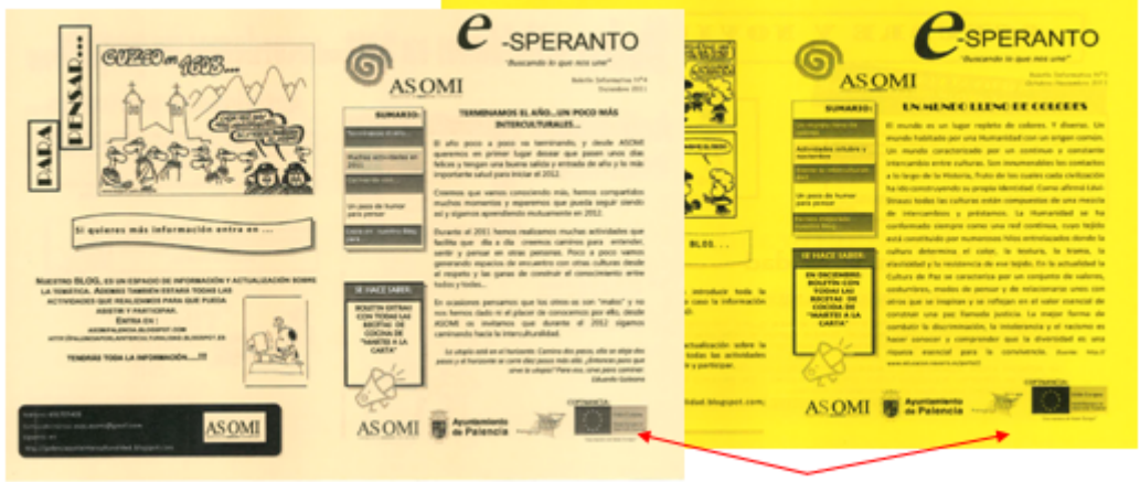
Se indica la cofinanciación de la Unión Europea.