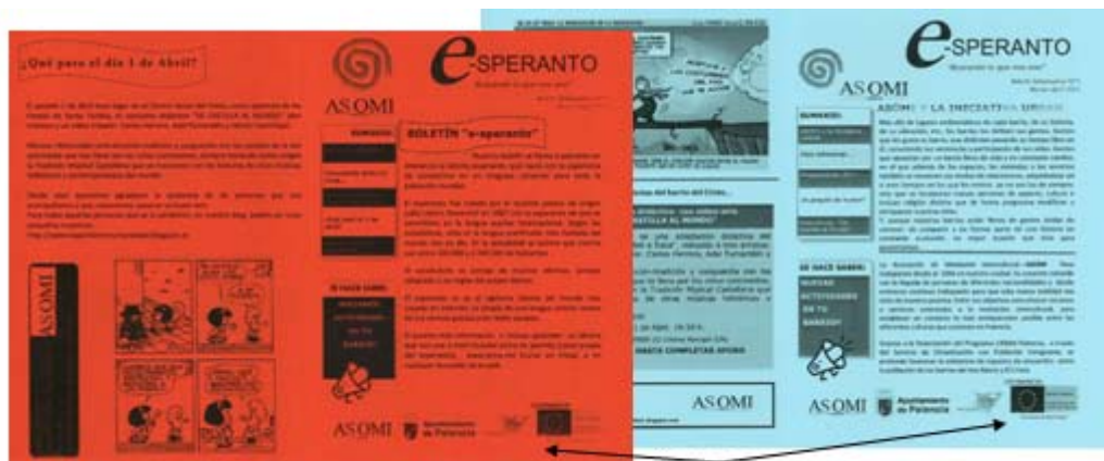
Se indica la cofinanciación de la Unión Europea.

Se ha editado también un boletín extra para el mes de diciembre de 2011, y que ha sido un recopilatorio de todas las recetas que se han trabajado en las sesiones “Encuentros gastronómicos del Mundo” , debido al gran éxito y aceptación que ha tenido entre todos los vecinos de los barrios.