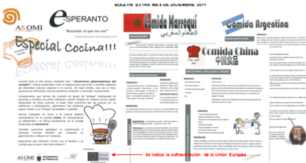
Se indica la cofinanciación de la Unión Europea.

Se ha editado también un boletín extra para el mes de diciembre de 2011, y que ha sido un recopilatorio de todas las recetas que se han trabajado en las sesiones “Encuentros gastronómicos del Mundo” , debido al gran éxito y aceptación que ha tenido entre todos los vecinos de los barrios.